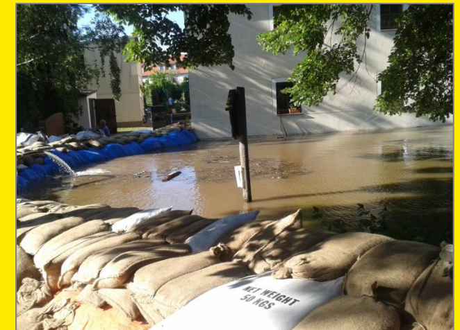
Sandsackdamm in Altübigau beim Elbe-Hochwasser Juni 2013

Aufbauanleitung für Sandsackdämme zum Schutz vor Elbehochwasser mit Wasserständen von 800 bis 900 cm Pegel Dresden